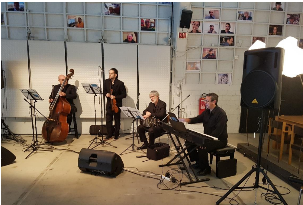
Aux Théâtre Les Halles